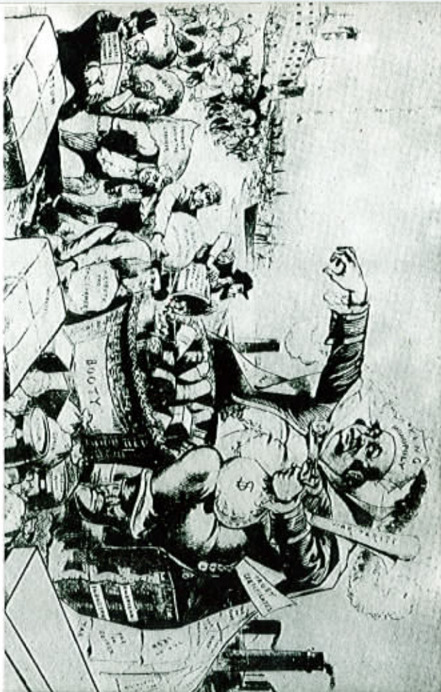
ترجمة: محمد البكري محمد بولعيش